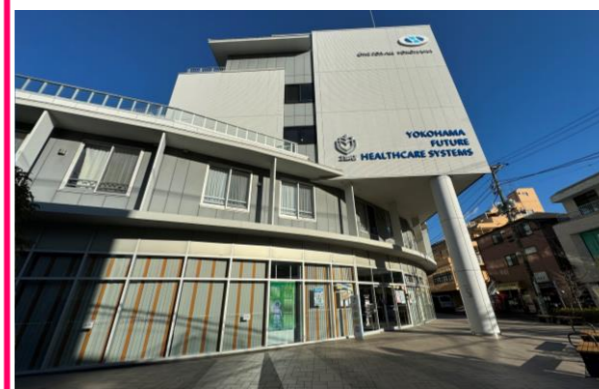
⑮OEN FOR ALL横浜 地域交流センター (戸塚共立レディースクリニック・戸塚共立透析クリニック)